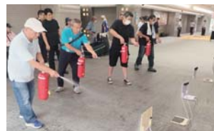
▲ 消火器による放水訓練。

皆様、暑いなかお疲れさまでした。参加者には後日「消防訓練実施済証」をお渡しいたします。