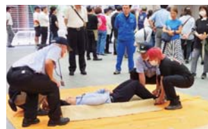
▲ 毛布を使った簡易担架での救助者の搬送。