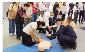
▲ AEDの使い方を熱心に聞く参加者。