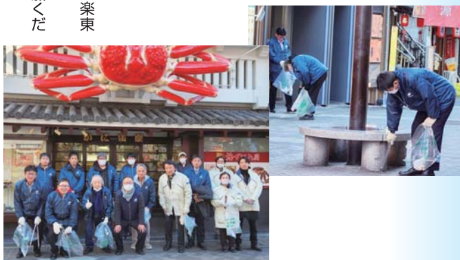
▲昨年ご参加頂いた道頓堀商店会と道頓堀車連連盟の皆様。

ミナミを一斉大掃除！ べっぴんプロジェクトのご案内 「ミナミの街を自分たちで美しく」の思いで、ミナミまち育てネットワーク会員の商店街、企業の皆様が、賛同いただける地域の商店街の方々等とともに、一斉に清掃活動を行います。また、国内外の観光客にも「ミナミはいつもきれいにしています」と発信する機会にもなります。 今年もミナミのまちをべっぴんにするぞえー！ 日時：11月9日(土)9時45分スタート 11時解散予定 集合場所：かに道楽 東店前(※日本橋側です) (9時30分までに集合してください。) 雨天予備日：11月16日(土) 道頓堀商店会の皆さんは「道頓堀通り(かに道楽東店前)からはり重前」を掃除する予定です。 そうじ用具は用意いたします。ふるってご参加ください。