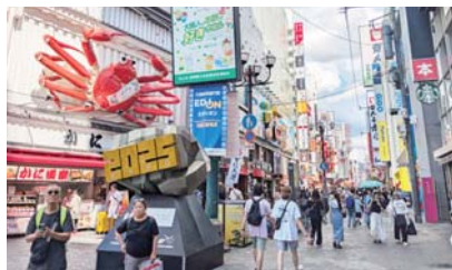
▲人でにぎわう道頓堀。

商店街に設置している防犯カメラに搭載された人流測定データによる、直近の来街者数を調べました。今年の8月は昨年同月比より微減となりました。日向灘で起きた地震や、関西にも上陸が予想された台風の影響か、特に27日以降の人流が減りました。10月にかけては暑さも一段落し、来街者が増える傾向にあります。それに伴い、ゴミの問題があります。IoTスマートゴミ箱設置によりかなり改善されました。また、大阪関西万博に向けて戎橋の公衆トイレの設置が進んでおりましたが、工事が遅れているようです。インパウンドのトイレ問題も深刻で早急にトイレが必要だと感じております。