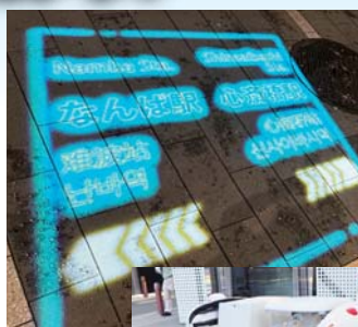
▲プロジェクションマッピングで 歩行者案内。