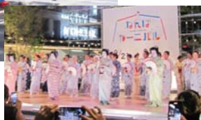
▶なんば広場で 「大阪芸妓in難波をどり会」。