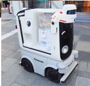
▲走るカプセルトイ。

当商店街も接している御堂筋において、実証実験「御堂筋チャレンジ2024」が9月22日～29日に行われました。難波西口交差点から淀屋橋交差点までの区間で行われ、エリア内に花飾りなどの装飾や、地域情報案内板を設置。夜間にはプロジェクションマッピングを使い歩行者案内をするなどデジタル技術も使われました。 この期間中の20日～22日、大阪・関西万博をターゲットに「御堂筋サテライトフレイル社会実験」も行われました。エリア内にマルシェを展開し、にぎわいを創出するほか、モビリティ実験も実施されました。22日はあいにくの天気となりましたが午後には雨も上がり、夕方からは各イベントも再開されました。長堀通りから道頓堀橋北詰を往復するモビリティは「乗車型」「配送型」の2種類あり、乗車型は人を座らせた状態で自走するまるで「走るベンチ」のようなマシンでした。配送型は訪日客に人気の「カプセルトイ」が自走するもので、買われている方もおられました。 この実験において、モビリティ走行の有効性や、歩行者への影響を調べるという目的です。