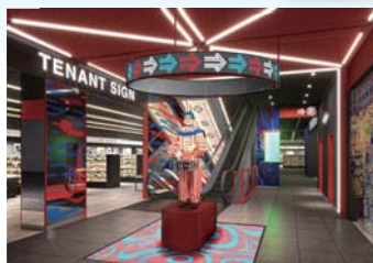
▲ 1階 おかえり、くいだおれ太郎。