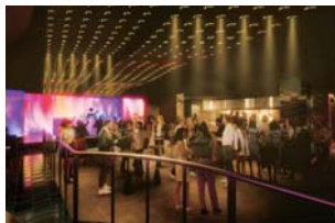
▲ 5階 ジラフジャパン。