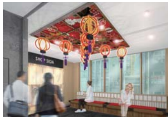
▲ 3階 芝居茶屋を疑似体験できる休憩スペース。