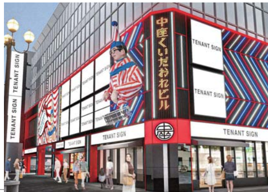
▶ 中座くいだおれビル外観イメージ

1階にはこれまで同様太郎さんが皆さまを出迎えます。また、天井や壁面には太郎のイメージカラーを盛り込んだ大胆なデザインを施し、太郎の世界観を演出。新たなフォトスポットへと生まれ変わります。2階には道頓堀のお狸様にお参りできるパワースポットが登場し、3階には芝居茶屋を体験できるスペースや壁面に松のデザインを施したスポットも設置されます。