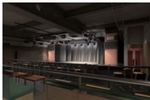
▲ 6階 よしもと道頓堀シアター。