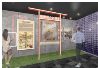
▲ 2階 鳥居前で道頓堀のお狸様にお参り。